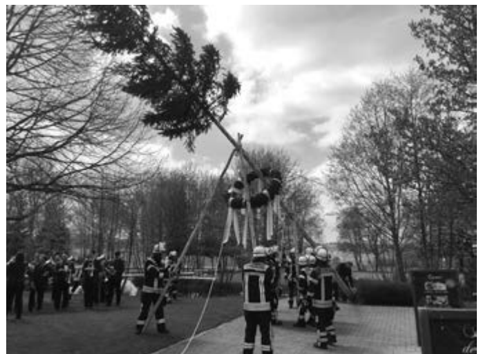
Am Montag stellt die Udingen Feuerwehr wieder den Maibaum im Golfclub.

Also nichts wie hin am Montag, 1. Mai, den Tag genießen und gemeinsam mit Freunden feiern. Der Golfclub freut sich auf viele Gäste.